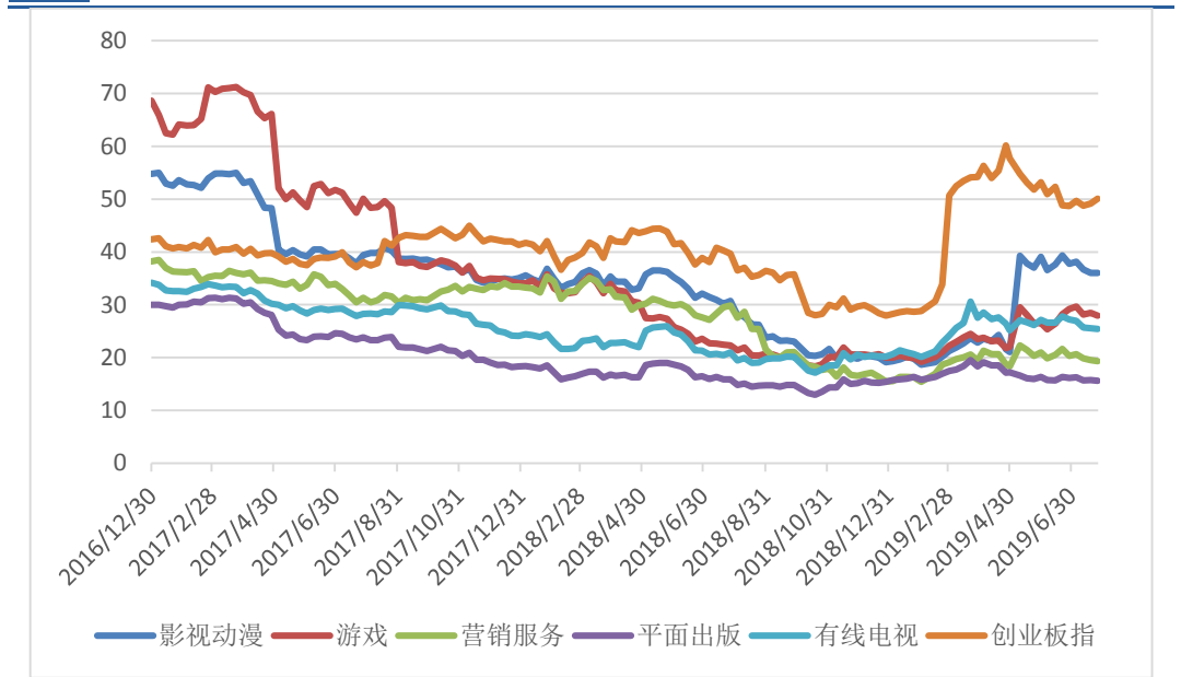
图 1: 2017 年初至今互联网传媒细分行业 PE 估值变化情况