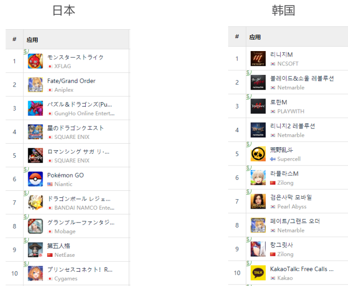
图 15：海外主要市场 Google 游戏畅销榜排名