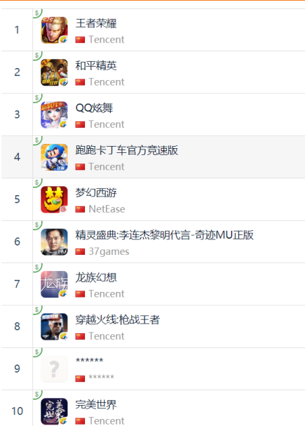
图 13：App Store 中国区畅销榜 TOP10

App Store 2019 年 8 月 17 日数据中国区畅销榜排行前三：腾讯《王者荣耀》、腾讯《和平精英》、腾讯《跑跑卡丁车官方竞速版》。此外，网易《梦幻西游》排名第四，腾讯《龙族幻想》排名第五。特别提醒三七互娱《精灵盛典》及完美世界出品、腾讯发行《完美世界》在畅销榜第六、第十。