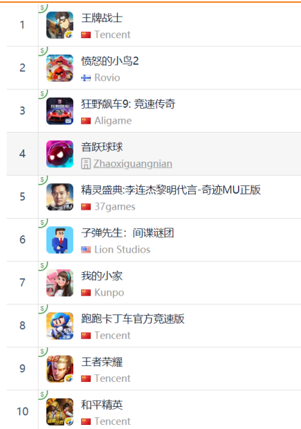
图 12：App Store 中国区免费榜 TOP10

App Store 2019 年 8 月 17 日数据中国区免费榜下载量排行前三中，腾讯《王牌战士》、阿里游戏《狂野飙车 9：竞速传奇》排名第一、第三。此外，三七互娱《精灵盛典》、腾讯《跑跑卡丁车官方竞速版》、腾讯《王者荣耀》、腾讯《和平精英》分别排名免费榜第五、第八、第九、第十。